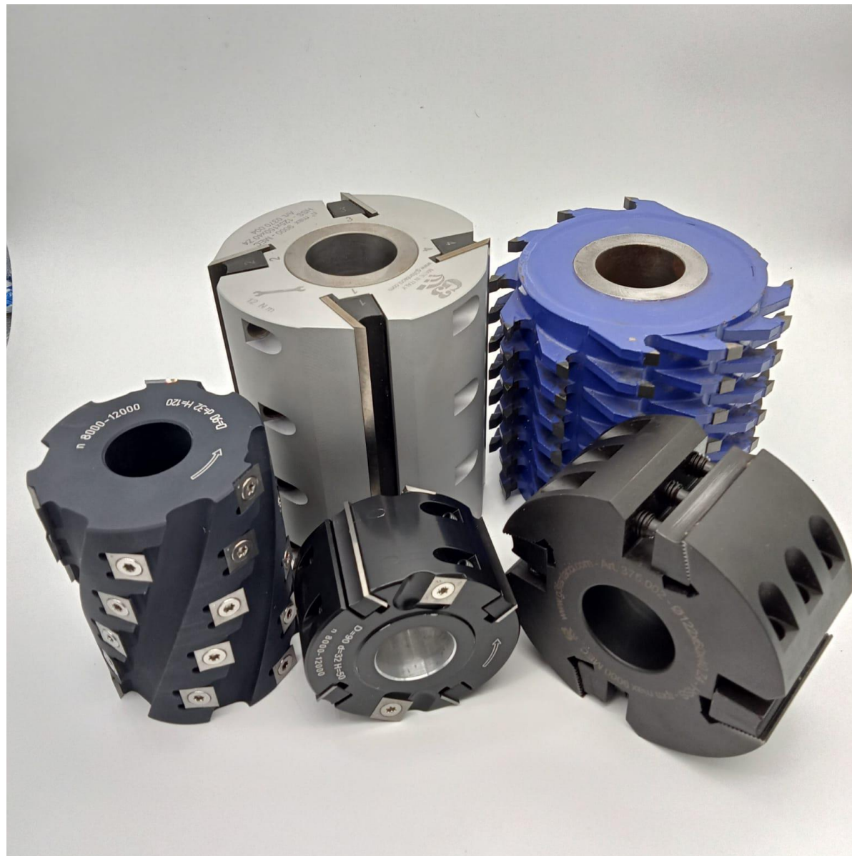
Фото к буклету: Строгальные барабаны для вертикально фрезерных и четырехсторонних строгальных станков....